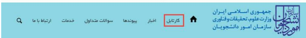
تصویر ۱۰-کارتابل شخصی

با توجه به روند فرآیند، درخواست بررسی شده با عنوان زیر در کارتابل شما قرار می گیرد.در قسمت جستجو کد پیگیری دریافتی را وارد و با توجه به توضیحات ذکر شده از چگونگی درخواست خود مطلع شوید