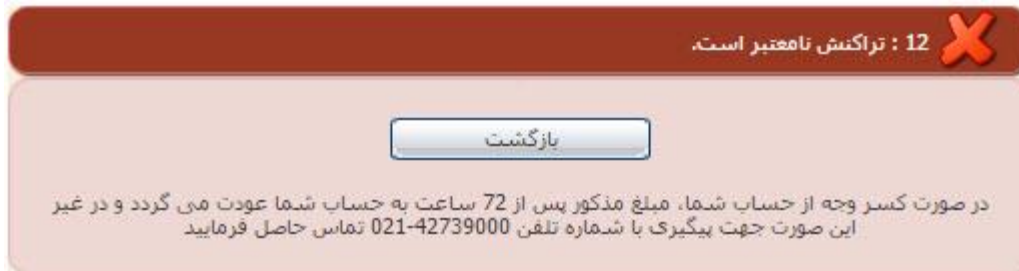
تصویر ۹-نمایش اخطار تراکنش ناموفق

با دریافت پیغام جهت مراجعه به پورتال، برای مشاهده وضعیت خود اقدام نمایید. از طریق پورتال سازمان امور دانشجویان سربرگ