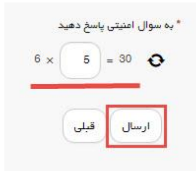
تصویر ۴- سوال امنیتی

سپس به سوال امنیتی پاسخ داده و بر روی دکمه ارسال کلیک کنید.(تصویر ۴)