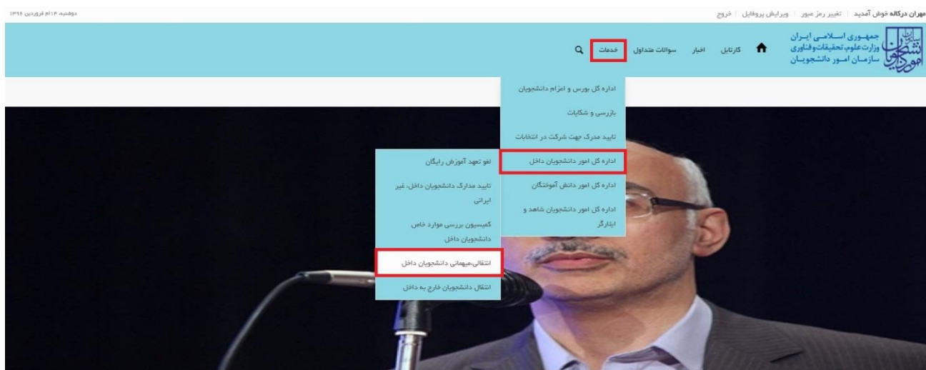
تصویر ۱- نمایش پورتال

توجه بفرمایید که متقاضی برای مشاهده این درخواست در منوی خدمات، باید حداقل یک مقطع تحصیلی کاردانی یا کارشناسی داخل کشور با وضعیت تحصیلی شاغل به تحصیل (نوع دانشگاه غیر از پیام نور و جامع علمی کاربردی) یا یک مقطع تحصیلی داخل کشور دکتری حرفه ای در رشته دامپزشکی با وضعیت تحصیلی شاغل به تحصیل در پروفایل ثبت نام خود داشته باشد. در صورت عدم مشاهده این درخواست، پروفایل خود را از طریق گزینه ویرایش پروفایل، اصلاح نمایید و سپس از منوی خدمات به ثبت درخواست مربوطه بپردازید.