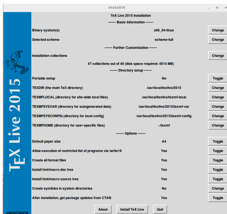
شکل ۱.۱: تصویر آغازین نصب TexLive 2015 در ویندوز

۳. کلیدهای دنباله زیر را از چپ به راست و به ترتیب بزنید و حدود ۳۱۰۰ بسته نصب شود.