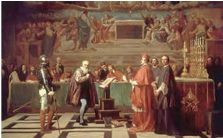
تابلوی گالیله در دادگاه تفتیش عقاید؛ او برای حفظ جان خود ناچار شد از عقاید علمی خود عقب نشینی نماید.

کلیسا در قرون وسطا برای مقابله با بی‌دینی و بدعت‌گذاری ۱ و جلوگیری از اندیشه‌های مخالفان خود، از حربۀ تفتیش عقاید یا انکیزیسیون ۲ استفاده می‌کرد. متهمان به بی‌دینی و بدعت‌گذاری از کلیسا اخراج و به سختی مجازات می‌شدند. تبعید، مصادرة دارایی، به چوب بستن و سوزاندن از جمله مجازات‌های این گونه متهمان بود.