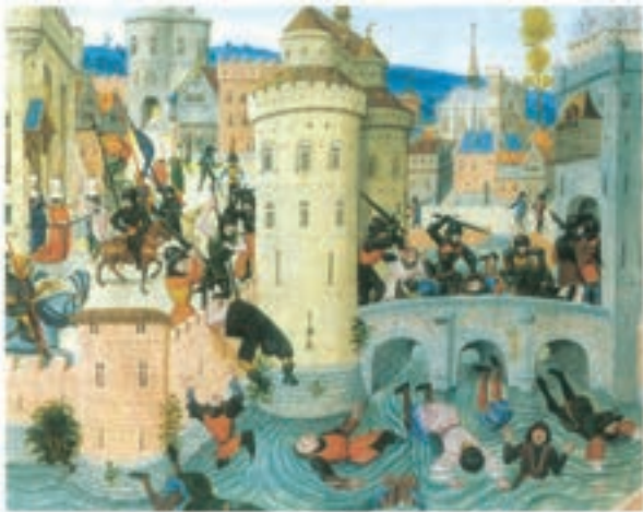
تابلوی سرکوب شورش کشاورزان توسط اربابان در قرن ۱۴م - انگلستان

وضعیت و موقعیت سرف‌ها؛ در قرون وسطا کار بر روی زمین‌های اربابان (فتودال‌ها) به عهدهٔ میلیون‌ها کشاورز وابسته به زمین بود که به آنها سرف می‌گفتند. گروهی از سرف‌ها، کشاورزان آزادی بودند که به علت بدهکاری سرف شدند. همچنین عده‌ای از کشاورزان به خاطر ناامنی و هرج و مرج زمین خود را به فرد نیرومندی واگذار کردند و در عوض آن از حمایت او برخوردار شدند. سرف‌ها در پایین‌ترین مرتبهٔ اجتماعی نظام فتودالی قرار داشتند. سرف اجازه نداشت که ملک ارباب خود را ترک کند، اما در عین حال مانند برده نیز نبود که قابل خرید و فروش باشد.