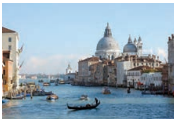
ونیز - ایتالیا

از سده ۱۱م به تدریج در اروپا شهرنشینی و تجارت در پیوندی تنگاتنگ با یکدیگر دوباره رونق گرفت. جنگ‌های صلیبی تأثیر فراوانی بر رشد شهرها و تجارت به ویژه در مناطق ساحلی اروپا گذاشت. تأثیر این جنگ‌ها بر رونق و شکوفایی شهرها در ایتالیا بیش از سایر سرزمین‌های اروپایی بود. شهرهای ایتالیایی در آن زمان، سرآمد شهرهای اروپا در تجارت، بانکداری و صنعت به شمار می‌رفتند. شهرهای بندری ونیز ۱ ، جنوا ۲ ، پیزا ۳ و پالمو ۴ تجارت در دریای مدیترانه و سواحل غربی اروپا را در اختیار داشتند. فلورانس ۵ ، مرکز داد و ستد کالاهای قیمتی فلزی و چرمی بود و تجارت پارچه را در بخش وسیعی از اروپا به خود اختصاص داده بود.