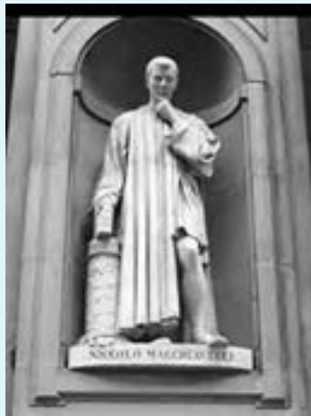
تندیس نیکولو ماکیاولی