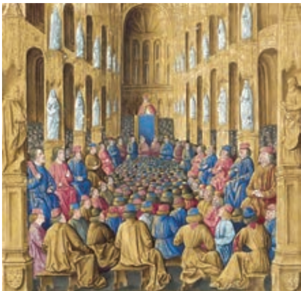
پاپ اوربان دوم هنگام موعظه و تشویق مسیحیان برای شرکت در جنگ‌های صلیبی - اثر جین کلمبو نقاش فرانسوی قرن ۱۵م

۱- مشکلات اقتصادی و اجتماعی سرزمین‌های اروپایی: به دنبال هجوم و مهاجرت گسترده طوایف ژرمنی به سرزمین‌های