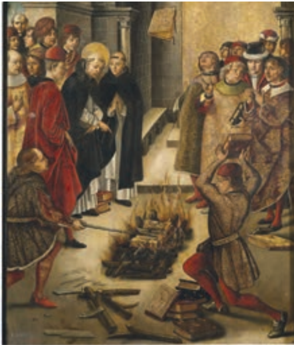
تابلوی قدیس سن دومینیک در حال نظارت بر سوزاندن کتاب‌های بدعت آمیز

فکر و فرهنگ را به دست گرفتند و کلام، فلسفه، اخلاق، ادبیات و هنر را مطابق میل و سلیقه خود تعلیم می‌دادند. آنان تفسیر کتاب مقدس را حق انحصاری خود می‌شمردند و اجازه نمی‌دادند که این کتاب جز به زبان لاتین به زبان‌های دیگری ترجمه و منتشر شود. کلیسا همچنین در قرون وسطا موفقیت زیادی در گسترش مسیحیت در میان ژرمن‌ها و سایر اقوام مهاجم به اروپا کسب کرد. علاوه بر اینها، کلیسا دارای املاک و زمین‌های بسیاری در سرتاسر اروپا و به خصوص ایتالیا بود. رسم بخشش گناهان از جمله رسوم دینی بود که نفوذ و تأثیر گسترده کلیسا را در قرون وسطا نشان می‌دهد. بدین منظور شخص گناهکار در برابر کشیش به گناه خود اعتراف می‌کرد و خواهان بخشش می‌شد. معمولاً بخشش خواهان برای لغو کیفر گناهان خویش پولی را پرداخت می‌کردند که برای کارهای خیر و عام‌المنفعه مانند ساخت و تعمیر کلیسا، بیمارستان، سدها و جاده‌ها مصرف می‌شد.