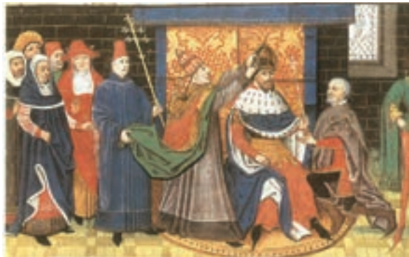
تابلوی تاج‌گذاری شارلمانی توسط پاپ لئوی سوم (عید کریسمس ۸۰۰ م)