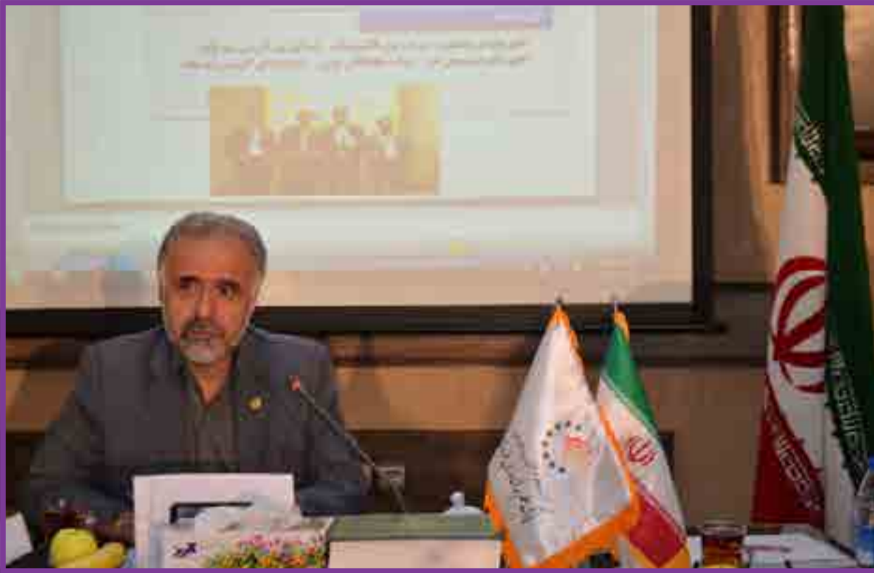
رئیس پارک علم و فناوری خراسان: