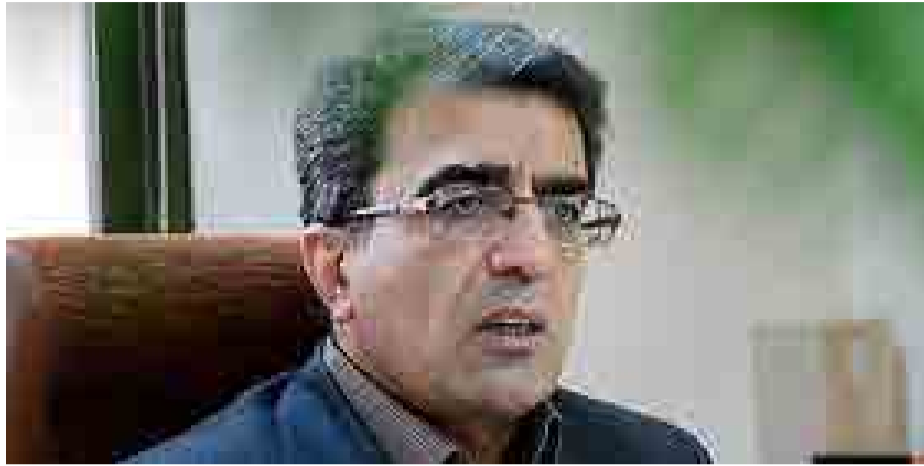
معاون پژوهشی وزیر علوم: