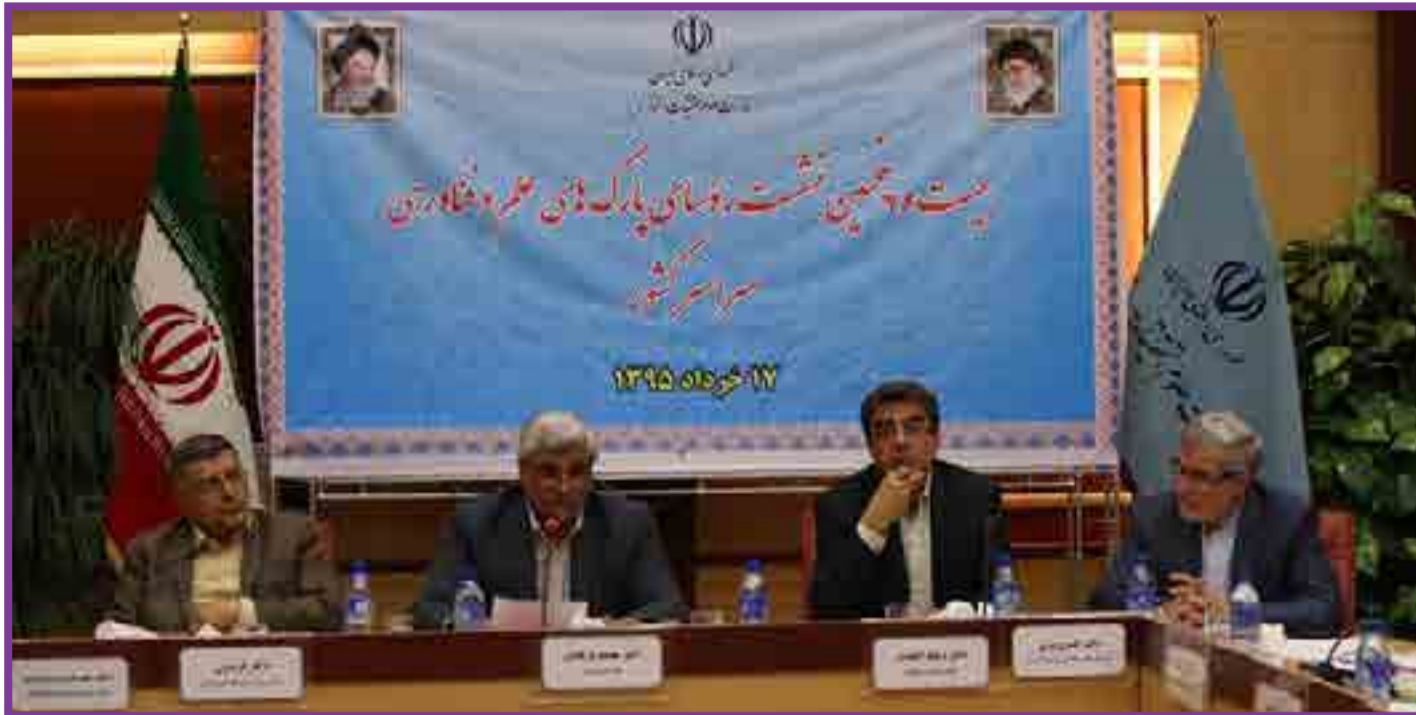
وزیر علوم تاکید کرد