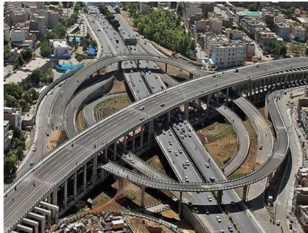
نمونه‌ای از پل‌های قوسی بتن آرمه با انحنای متفاوت عرشه