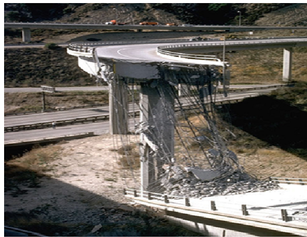
نمونه‌ای از گسیختگی عرشه بتن آرمه پل قوسی شکل - زلزله ۱۹۹۴ نورتریج

با توجه به شرایط هندسی خاص و رفتار متفاوتی که پل‌های نامنظم (از جمله پل‌های قوسی) نسبت به پل‌های مستقیم در جریان زلزله از خود بروز می‌دهند، نیاز به بررسی میزان آسیب لرزه‌ای آن‌ها بیش از پیش ضروری به نظر می‌رسد. در شکل زیر نمونه‌ای از گسیختگی عرشه پل قوسی بتن آرمه در زلزله نورتریج مشاهده می‌گردد.